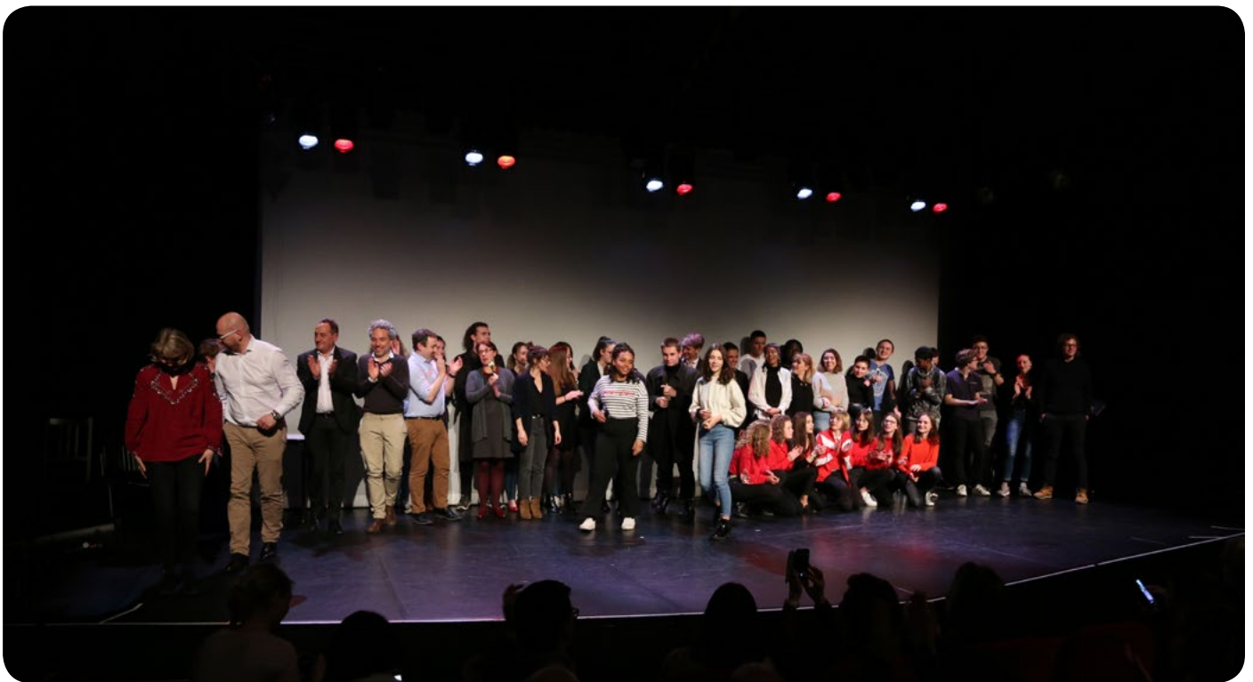
Soirée de remise de prix binôme academy - mars 2019

Nous proposons systématique des actions de sensibilisation en classe lorsque qu'un groupe scolaire vient découvrir un binôme. Et nous menons très régulièrement les Ateliers Science & Fiction dans le cadre de manifestation de culture scientifique.