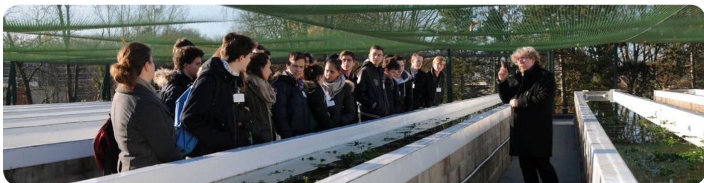
Visite de l'INERIS par les élèves du lycée Saint Vincent de Senlis - 9 décembre 2015.