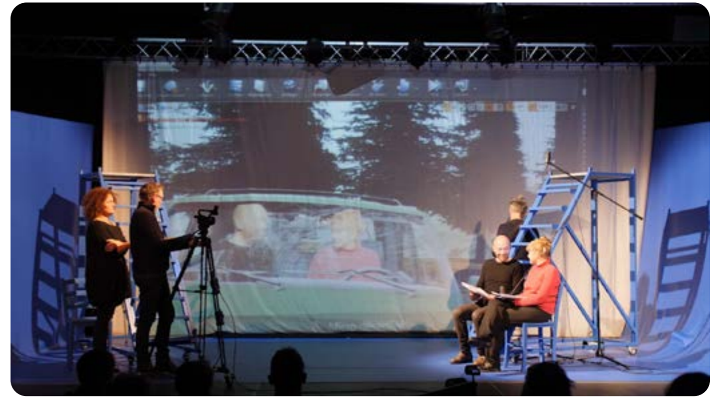
Résidence dans le cadre de la saison numérique du Doubs - en partenariat avec la Sarbacane Théâtre Mars 2022

La réalité virtuelle se superpose à la réalité non virtuelle pour offrir un nouveau support d'imaginaire aux spectateurs. La réalité est donc en question.