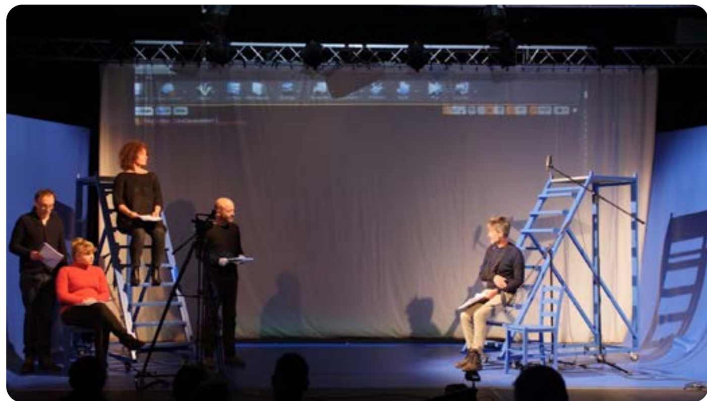
Résidence dans le cadre de la saison numérique du Doubs - en partenariat avec la Sarbacane Théâtre Mars 2022

L'idée est de donner à voir au spectateur le making of du film qui est en train de se créer devant lui. De la même façon que la lecture de la pièce est multiple, nous souhaitons donner accès à plusieurs niveaux de lecture simultanément. Au plateau une scénographie épurée, monochrome permet un traitement non réaliste, voir cubiste de cette fiction intimiste. Dans un même temps, grâce à la projection en temps réel de la même action intégrée dans un univers numérique tantôt réaliste (intérieur de la maison, jardin...) ou totalement onirique (œuvre graphique, aérienne....), nous proposons une autre lecture du même instant. Par exemple un.e acteur.rice s'assied au plateau sur un cube bleu et simultanément il/elle apparaît à l'écran sur un fauteuil dans le salon de la maison. Cette double lecture simultanée d'une même scène est troublante et souvent drôle.