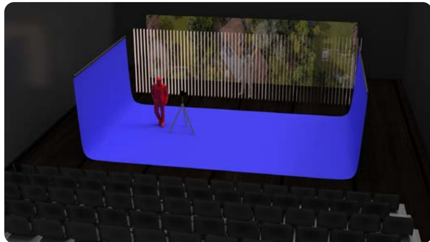
Scénographie DRAO

Le principe est l'utilisation de la réalité mixte pour plonger le comédien dans un décors virtuel qui peut évoluer avec lui.